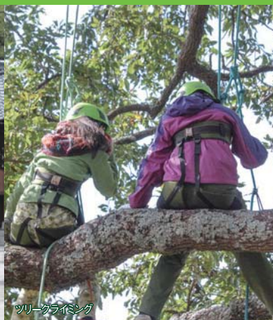
ツリークライミング