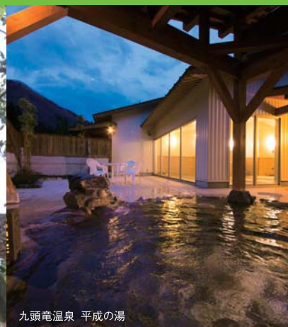
九頭竜温泉 平成の湯