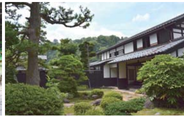
武家屋敷旧内山家